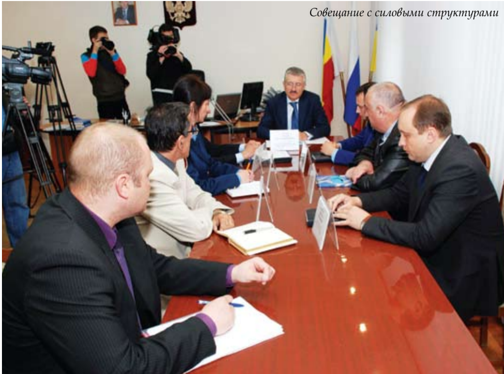
Совещание с силовыми структурами