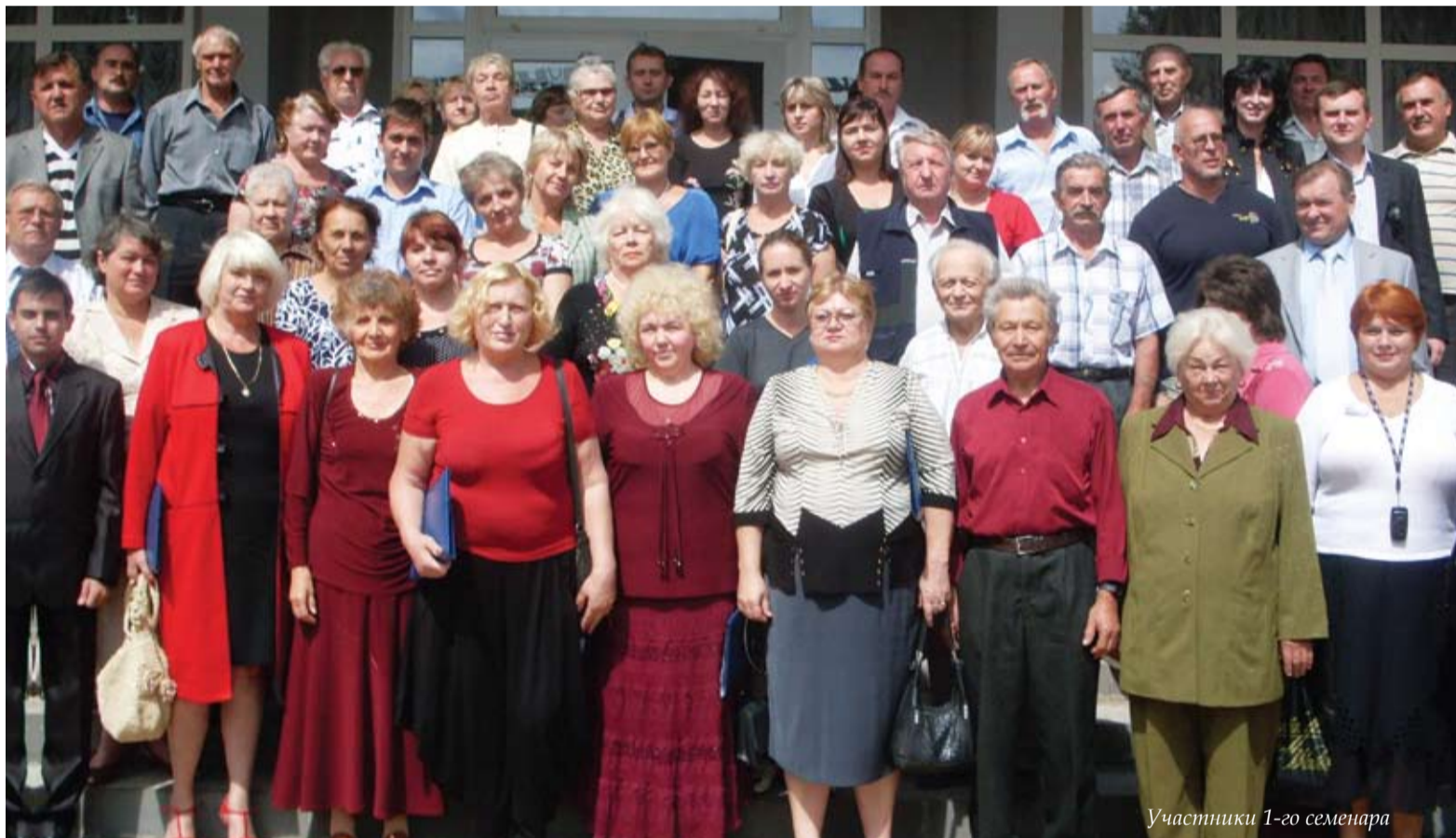
Участники 1-го семинара

дома и прилегающей к нему территории, и сюда тоже нужно вкладывать силы и средства. Наша пресловутая советская психология, когда человек мог пойти в администрацию и потребовать проведение ремонта в квартире, где он проживает, еще очень сильна в сознании людей, особенно старшего поколения. Практически все проблемы собственников завязаны именно на этом непонимании.