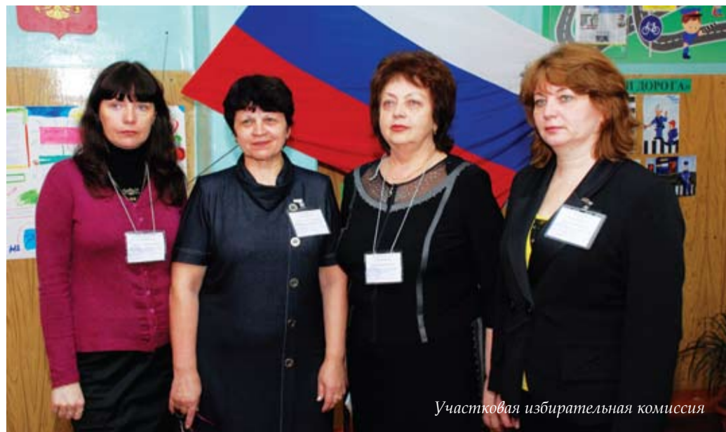
Участковая избирательная комиссия