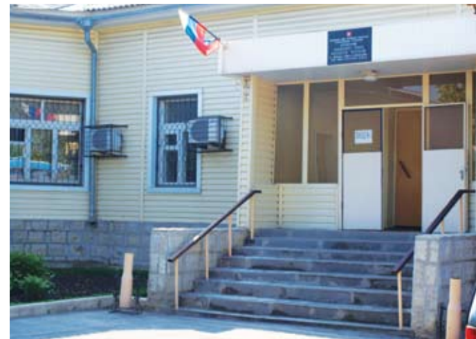
Объекты, обслуживаемые МУП «Красносулинские городские тепловые сети»